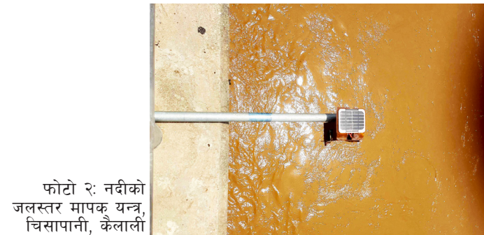
फोटो २: नदीको जलस्तर मापक यन्त्र, चिसापानी, कैलाली