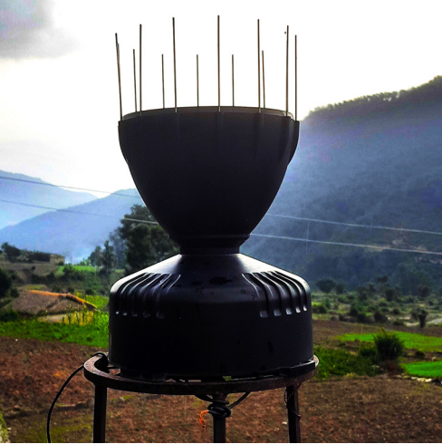
फोटो १: वर्षा मापक यन्त्र, आटिचौर, बाजुरा