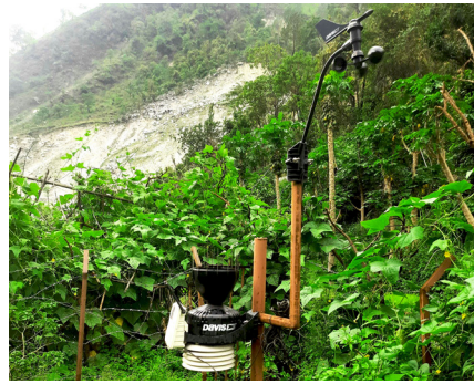
फोटो ३: स्वचालित मौसम मापक यन्त्र, ओलेना, बाजुरा